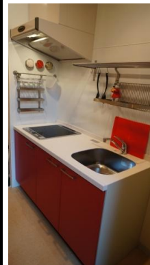
IHシステムキッチン 2口コンロ付